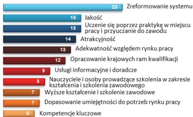
Rys. 2 Główny cel reformy polityki w zakresie kształcenia i szkolenia zawodowego w latach 2010–2014 (liczba państw)

Wysokie bezrobocie wśród osób młodych oznacza, że promowanie uczenia się dorosłych i mobilności odgrywa mniejszą rolę. Niemniej w ramach ustanawiania systemu przyuczania do zawodu Hiszpania zawarła porozumienia dwustronne z Niemcami, Portugalią i Zjednoczonym Królestwem dotyczące odbywania praktyk zawodowych za granicą.